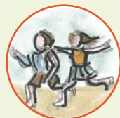
Erlebnis-Spielplatz mit Picknickstation